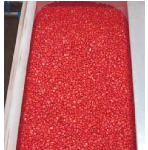
Насіння кукурудзи готове для посіву