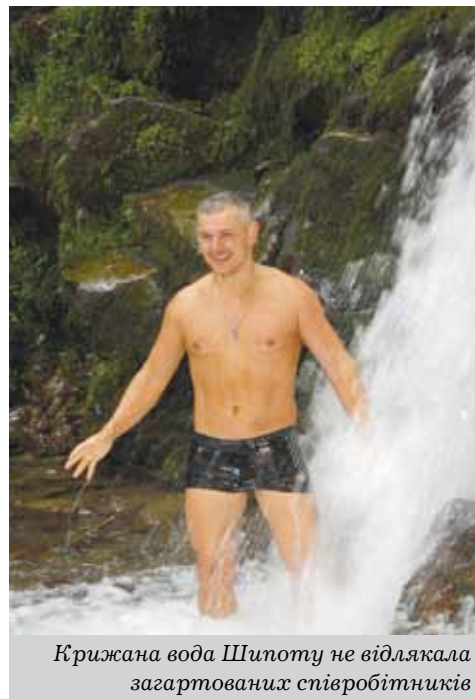
Крижана вода Шипоту не відлякала загартованих співробітників

У другу мандрівку вирушила вдвічі більша команда працівників фінансово-економічної служби разом з іншими працівниками підприємства. Для цього залізниця навіть замовила додатковий вагон потяга. Старовинні замки та їхня захоплива історія, екскурсія «смачною» сироварнею з дегустацією особливих видів сирів, ферма плямистого оленя, де з рогів цієї тварини виготовляють ліки, ну і звісно крижана вода Шипоту, в якій навіть дехто з наших колег наважився скупатися. Проте всіх без винятку вразила неймовірна природа краю, врапніший гірський туман, а також надзвичайно чисте повітря, яким неможливо надихатися.