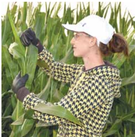
Видалення волоті вручну на материнській формі гібриду

Додаткові вимоги також пред'являються до вибору полів під ділянки гібридизації, адже потрібно дотримуватися просторової ізоляції – відстань до найближчих товарних посівів кукурудзи має становити не менше ніж 250 м.