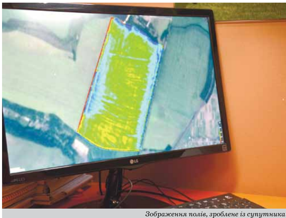
Зображення полів, зроблене із супутника