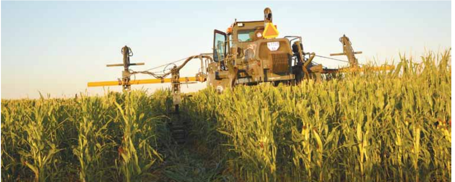
Спеціальна машина для видалення волоті та батьківських форм