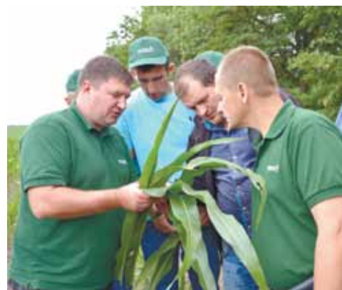
Огляд рослин гібридів кукурудзи

Ще два популярні гібриди кукурудзи на насіння – ЕС Астероїд (92 га) та ЕС Конкорд (28 га) – на замовлення компанії «Євраліс» вирощували в Лисянській філії, АФ «Дружба» та АФ «Батьківщина Шевченка». Опадів було мало, тому вже на початку вегетації можна було побачити різницю між кукурудзою, яка росте на поливі, і тією, яка позбавлена достатньої кількості вологи через брак опадів.